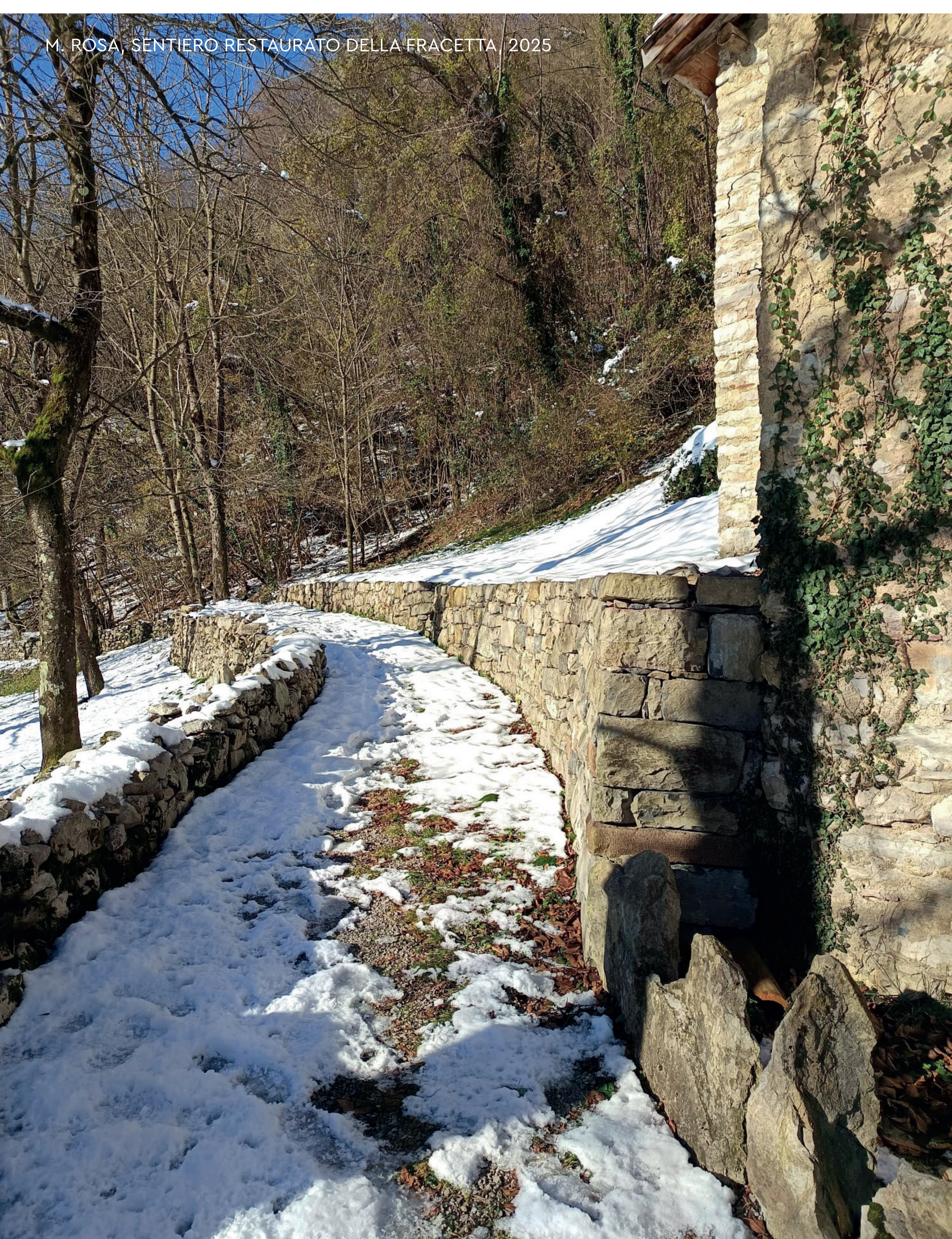
M. ROSA, SENTIERO RESTAURATO DELLA FRACETTA, 2025

Qui, le prime piste raggiungibili dalla pianura (grazie alla pioneristica Funivia) attiravano sciatori in gran numero, e qualcuno vide le opportunità di un turismo invernale promettente, ma forse stressante per i delicati equilibri montani.