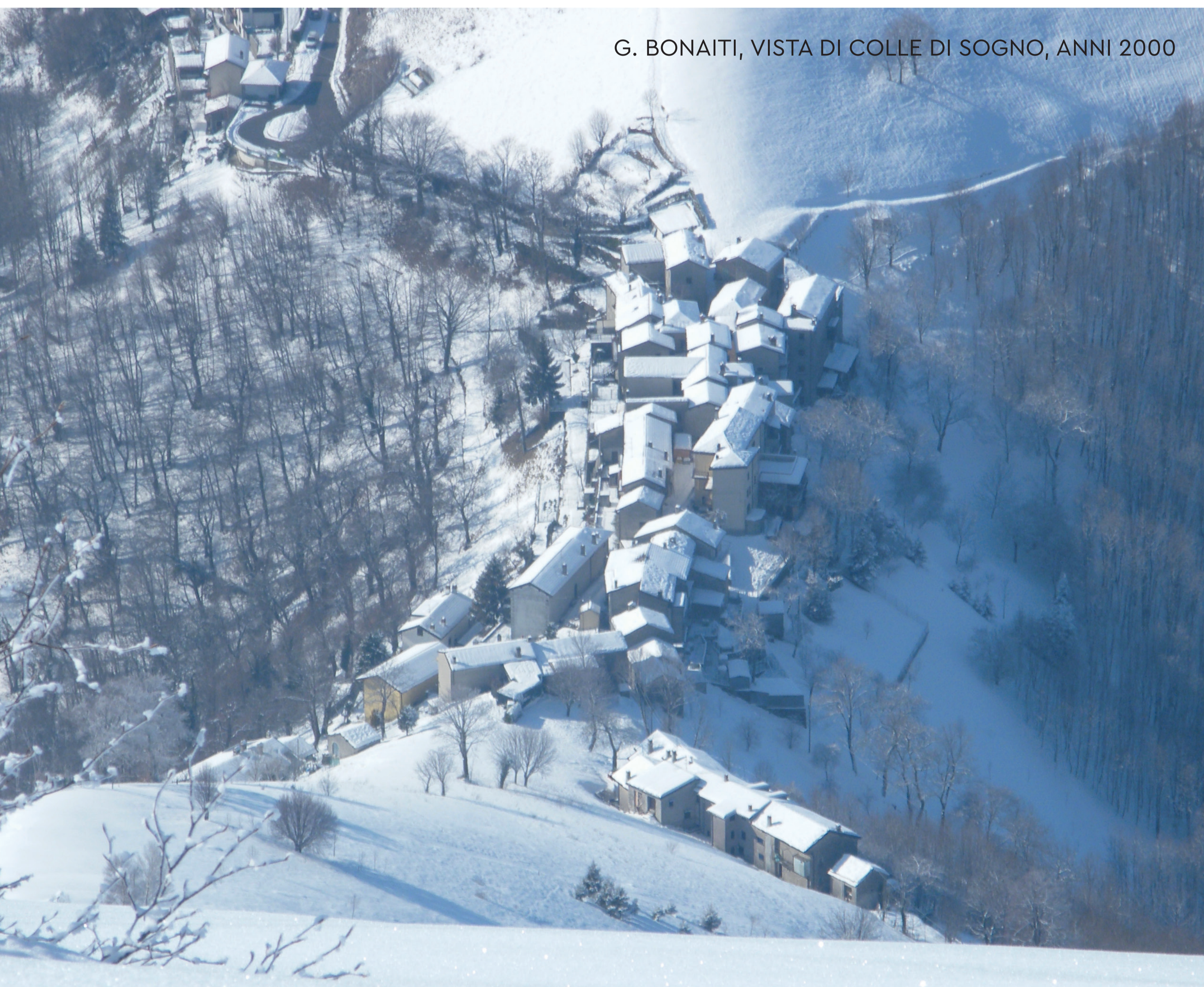
G. BONAITI, VISTA DI COLLE DI SOGNO, ANNI 2000

Alcuni appassionati creavano piste da sci di fondo nella piana del paese, mentre a un'ora di cammino, attraverso le frazioni di Boccio e Colle di Sogno, si raggiungevano il Pertüs e Valcava.