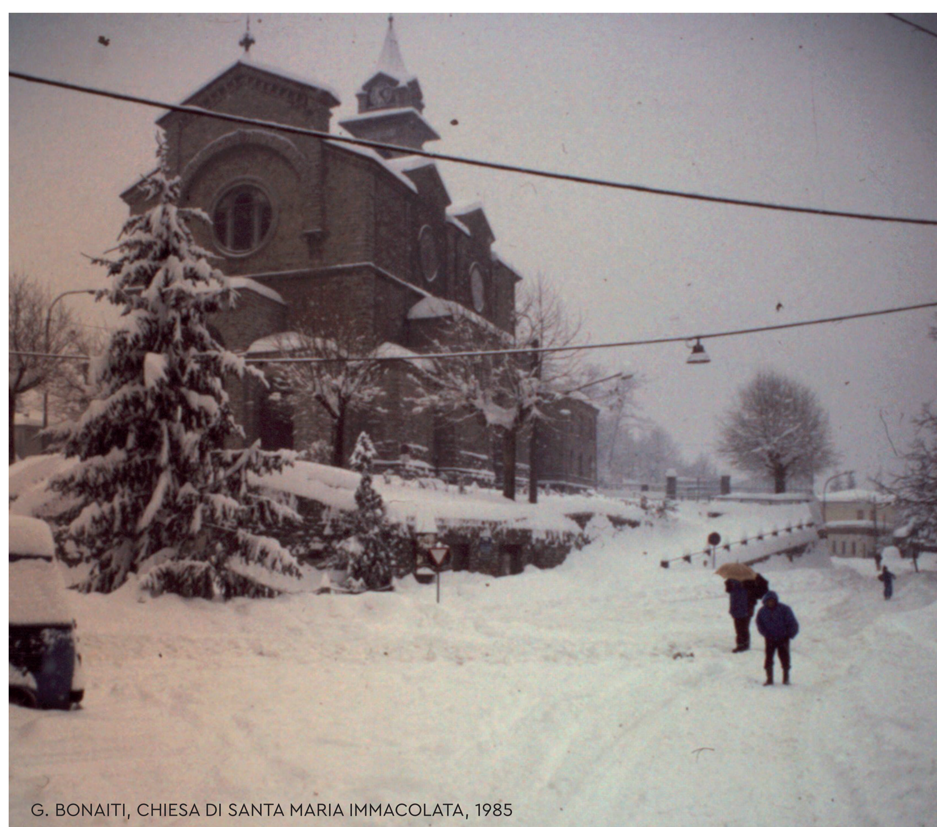
G. BONAITI, CHIESA DI SANTA MARIA IMMACOLATA, 1985

C'era la neve. Ca' Martì ne conserva la memoria, senza ignorare come il cambiamento climatico abbia stravolto il ritmo delle stagioni e spopolato le nostre montagne. Non crediamo saggio ricreare un passato 'artificiale', affidandoci a pratiche insostenibili: il rischio è di aggravare il debito ecologico verso questi luoghi fragili.