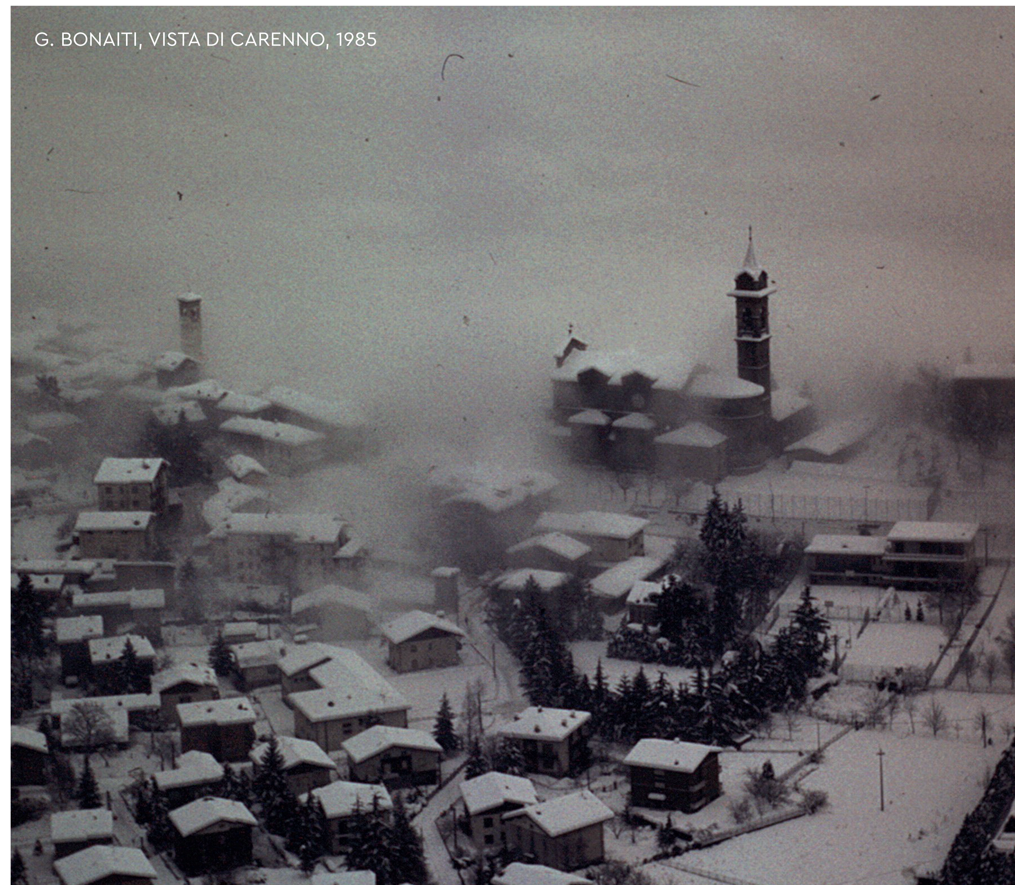
G. BONAITI, VISTA DI CARENNO, 1985

Alcuni appassionati creavano piste da sci di fondo nella piana del paese, mentre a un'ora di cammino, attraverso le frazioni di Boccio e Colle di Sogno, si raggiungevano il Pertüs e Valcava.