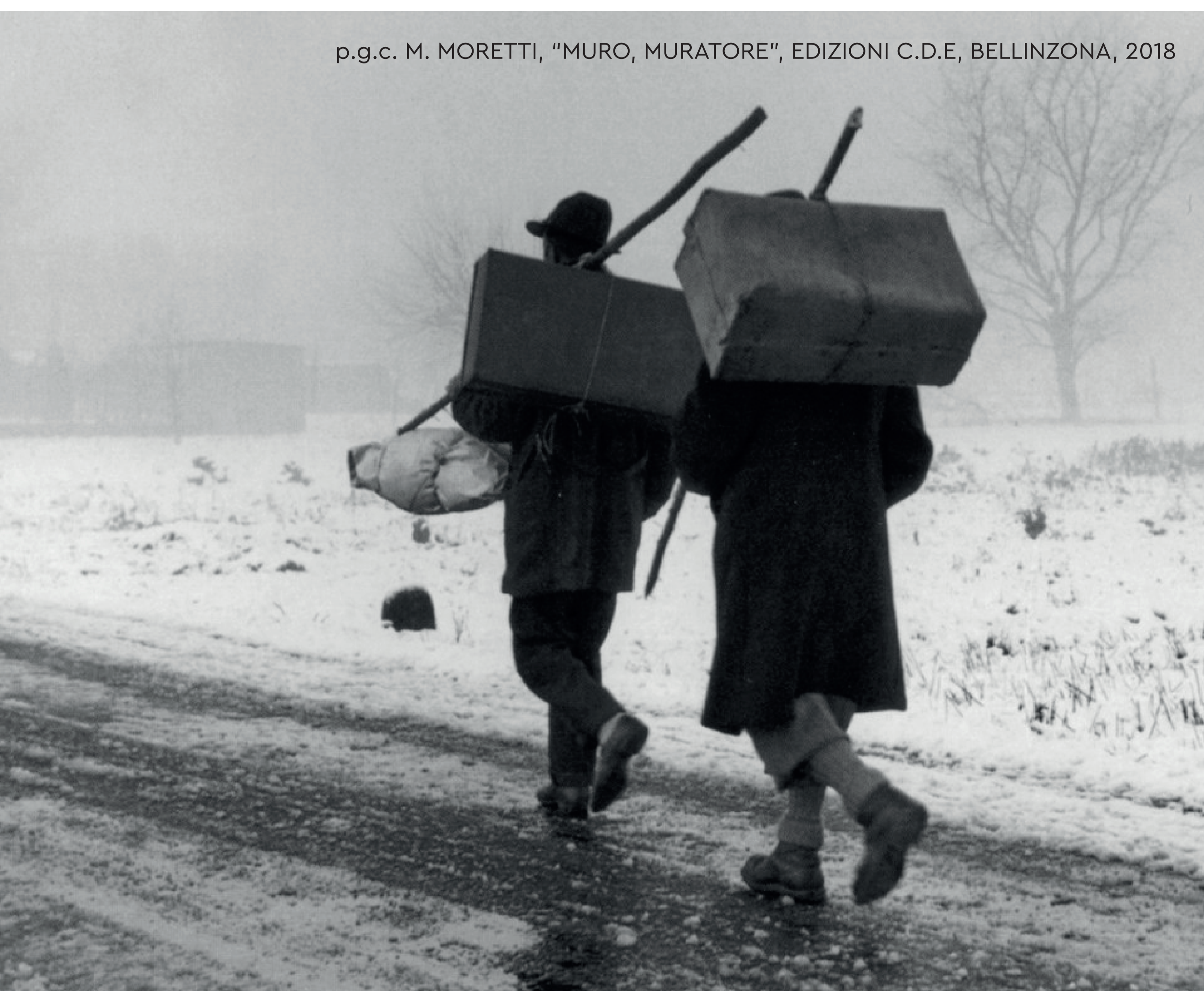
p.g.c. M. MORETTI, "MURO, MURATORE", EDIZIONI C.D.E, BELLINZONA, 2018

Non era solo una questione di clima: era il richiamo del paese, della famiglia, affidata per il resto dell'anno alla cura delle donne, così come la terra, che occorreva preparare al ciclo produttivo.